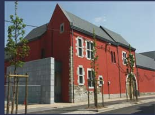
© Atelier d'architecture louis & royer