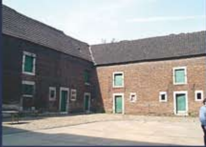
© Atelier d'architecture louis & royer