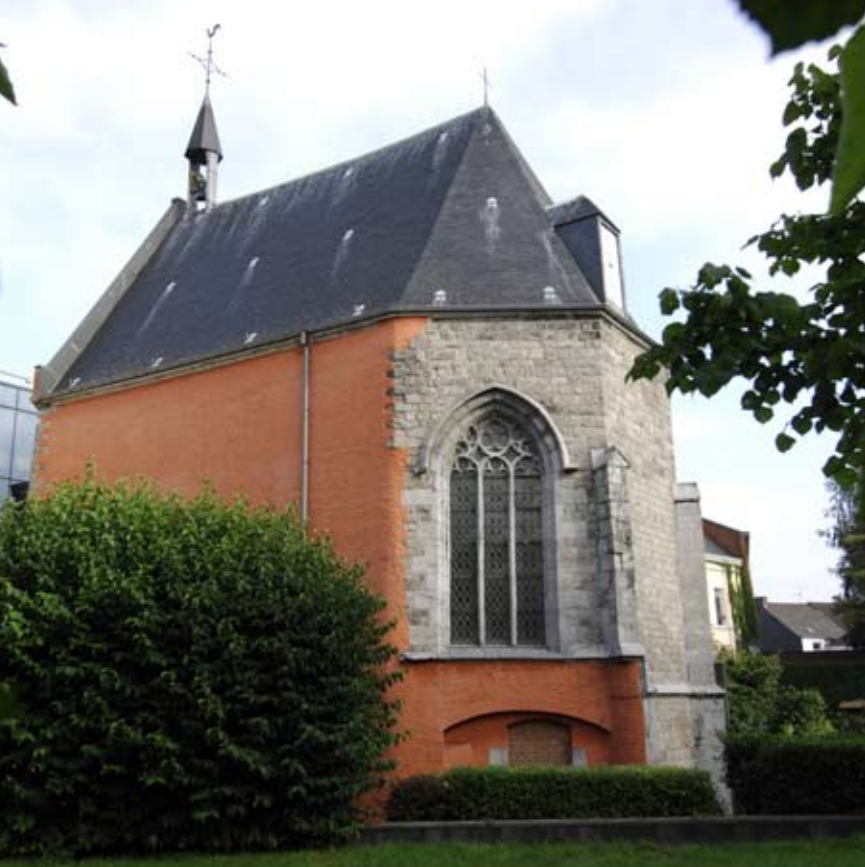
Vue du chevet