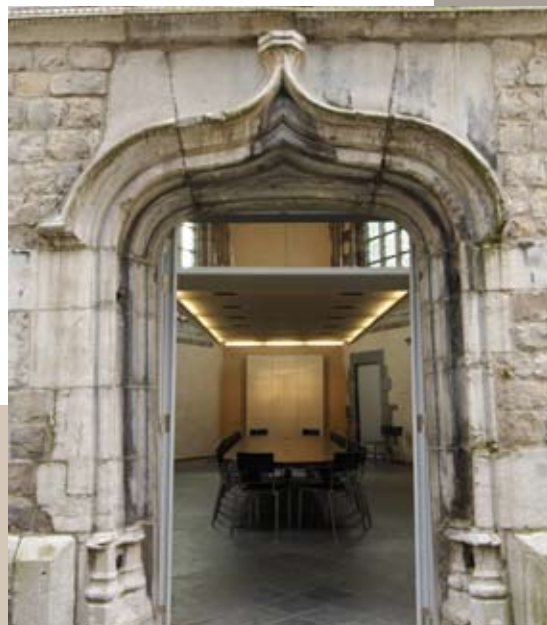
Entrée de la chapelle