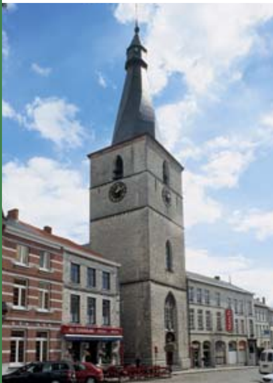
Chapelle Notre-Dame à Jodoigne.