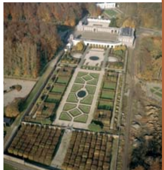
Le château de Senefve.