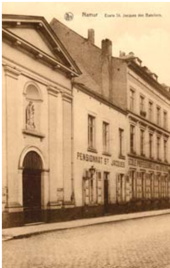
Carte postale ancienne. L'ancienne école des Bateliers

Les études présentées ainsi que de nombreuses autres recherches ont fait l'objet d'une publication de plus de deux cent pages distribuée à chaque participant. À vos agenda : la trentième édition est d'ores et déjà planifiée à Bruxelles les 16 et 17 mars 2007.