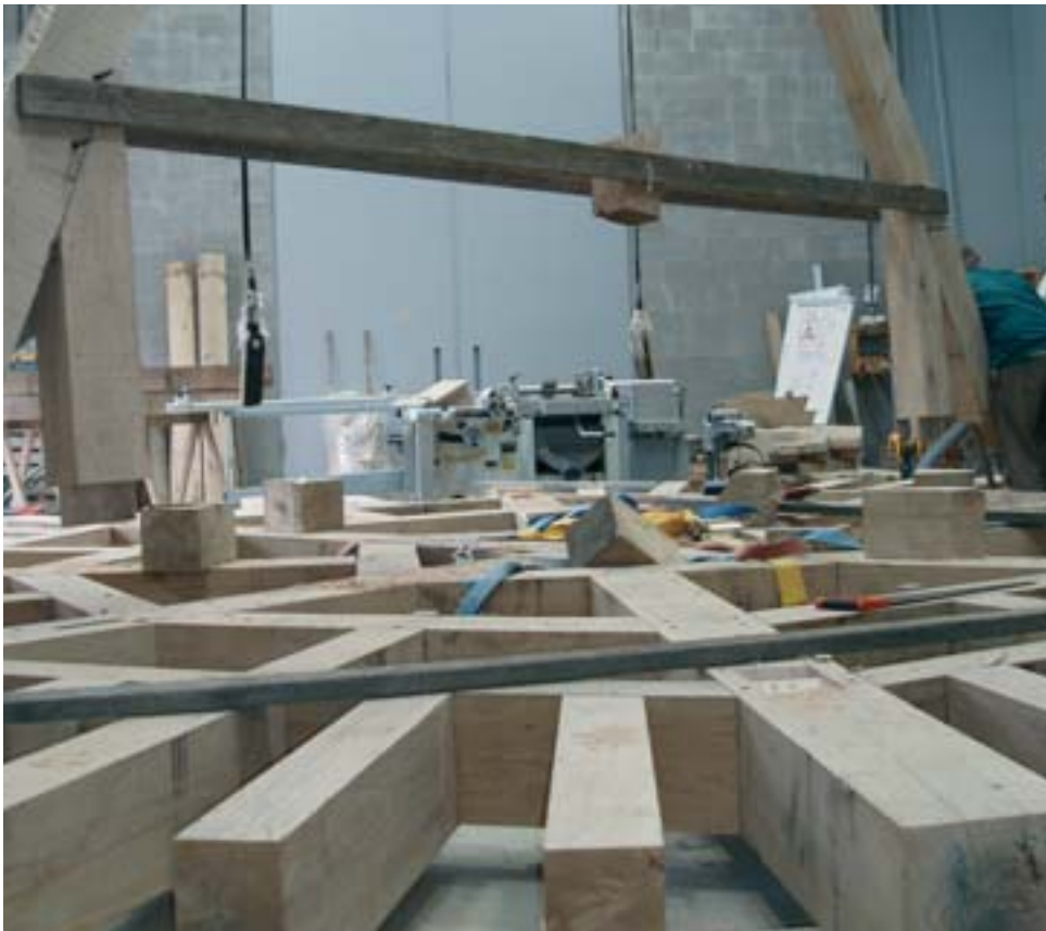
Première enrayure de la future charpente du colombier

Depuis le mois de mai 2005, ils sont cinq et leur formateur, Pascal Lemlyn, à venir régulièrement - cinq jours par mois - œuvrer à la reconstruction «à l'identique» de la charpente du colombier de la Paix-Dieu. Cinq aspirants-charpentiers, dont un Parisien, se sont inscrits dans le long terme pour mener à bien ce chantier-école.