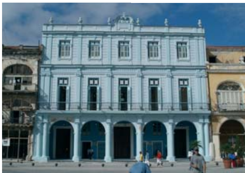
Le bâtiment Conde Canongo devenu... Casa Valonia

l'architecte Henri Garcia, réalisée par l'ébéniste Paul Mordan et dont le suivi de l'installation a été supervisé par la Direction des Relations internationales de la Région.