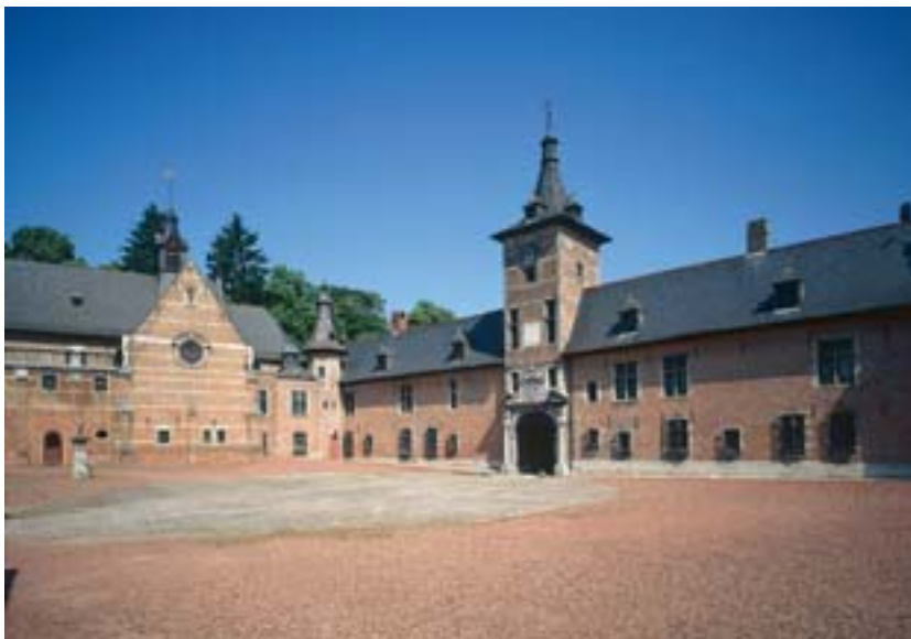
Le château de Rixensart.

Ainsi, le 22 septembre 2005, le Gouvernement wallon a octroyé deux subventions : la première est fixée à 1.351.000€, en vue de restaurer les façades, les toitures et le rez-de-chaussée du château Le Fy, la seconde, pour la première phase des travaux de consolidation des fondations de l'aile est du château de Rixensart, à 354.000€. De même, le 15 décembre, le Gouvernement a approuvé des travaux supplémentaires de restauration à effectuer aux châssis du château du Rœulx et a accordé pour