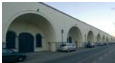
Les anciennes Casemates de Mons.

En décembre 2000, la Région wallonne, propriétaire des Casemates de Mons, a délégué à l'IPW la maîtrise d'ouvrage pour la restauration des façades du bâtiment. Le cahier des charges, préalablement élaboré au sein du Ministère wallon de l'Équipement et des Transports en 1997, a été transmis à l'Institut de même que l'enveloppe budgétaire réservée à ce premier chantier (1.725.000€ TVAC). Pour les travaux, qui ont débuté en août 2003, il était initialement prévu de décaper le cimentage de surface et de ragréer ponctuellement les maçonneries. Or, la tâche s'est révélée plus étendue que prévu puisque c'est un épouillage systématique des maçonneries qui s'est imposé, suivi d'un reappareillage de l'ensemble des zones touchées. Face à cette situation imprévue, l'IPW et la Direction de la Restauration ont consulté le CSTC (Centre Scientifique et Technique de la Construction) et l'ISSEP (Institut Scientifique de Service Public) afin d'obtenir leur avis sur le traitement à mettre en œuvre sur les façades. Un badigeon a donc été appliqué non seulement en vue de procéder à l'uniformisation esthétique, mais aussi d'assurer la protection des murs de briques contre les intempéries. Le choix de la teinte, opéré par l'IPW en collaboration avec la Direction de la Restauration, s'est porté sur un blanc coquille d'œuf, de manière à ne pas laisser transparaître les efflorescences de sels, présents dans les maçonneries. L'ensemble de l'opération s'est achevé en été 2005.