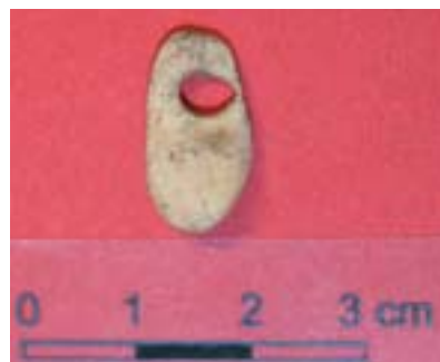
Vue de la pendeloque en os. Cliché. M. Van Dorp 2005 © ULg, Service de Préhistoire

La grotte du Trou Al'Wesse se situe sur la rive droite du Hoyoux dans la réserve naturelle de Modave. Découverte et fouillée en partie au XIX e siècle, le site fait l'objet de nouvelles recherches par le Service de Préhistoire de l'Université de Liège et les Chercheurs de la Wallonie depuis 1988, soutenus par le Ministère de la Région wallonne (DGATLP).