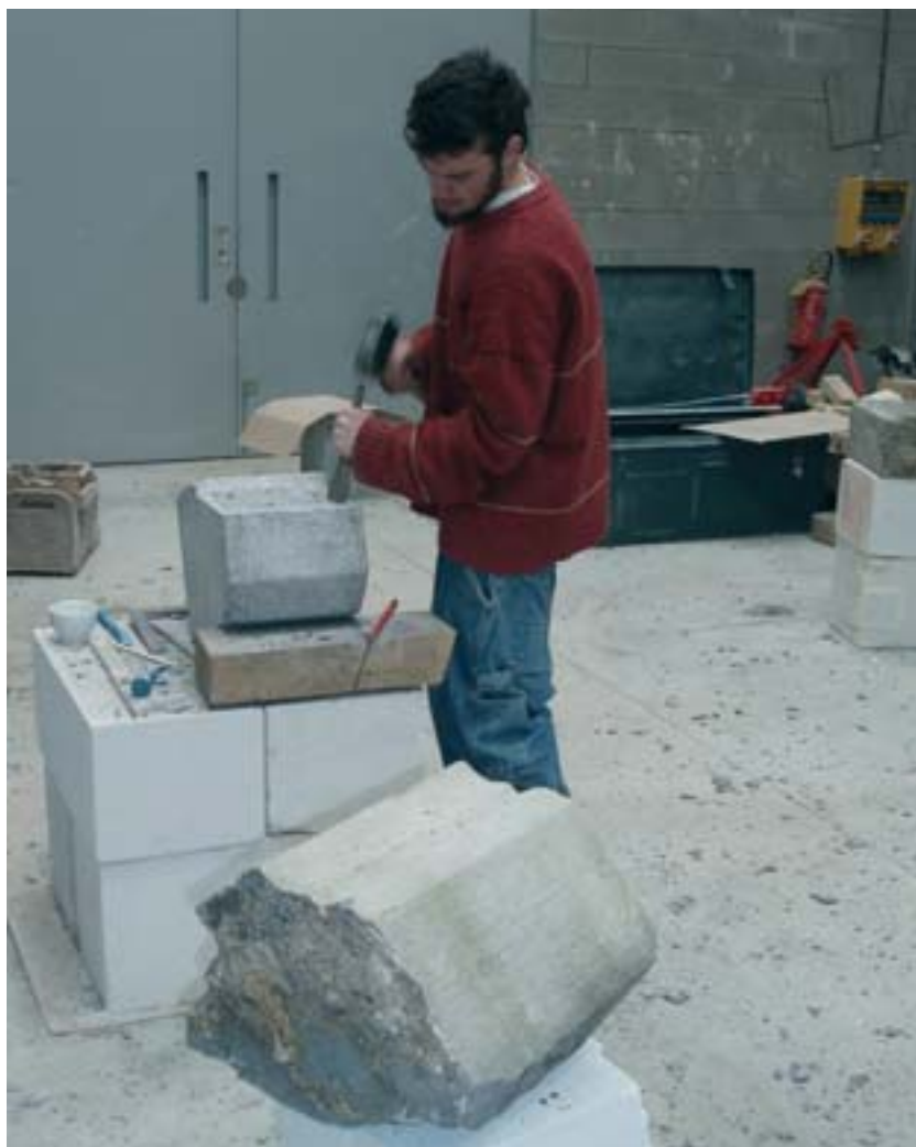
Tailler la pierre à la Paix-Dieu...

L'objectif de notre prochain programme est de répondre au mieux encore aux besoins du secteur, tant administratif que technique. Il arrivera dans votre boîte aux lettres dès le mois de juin prochain et il sera également disponible dès la fin juin sur notre site internet ( www.paixdieu.be ) que nous vous invitons à visiter régulièrement afin de connaître les dernières nouvelles du Centre de la Paix-Dieu.