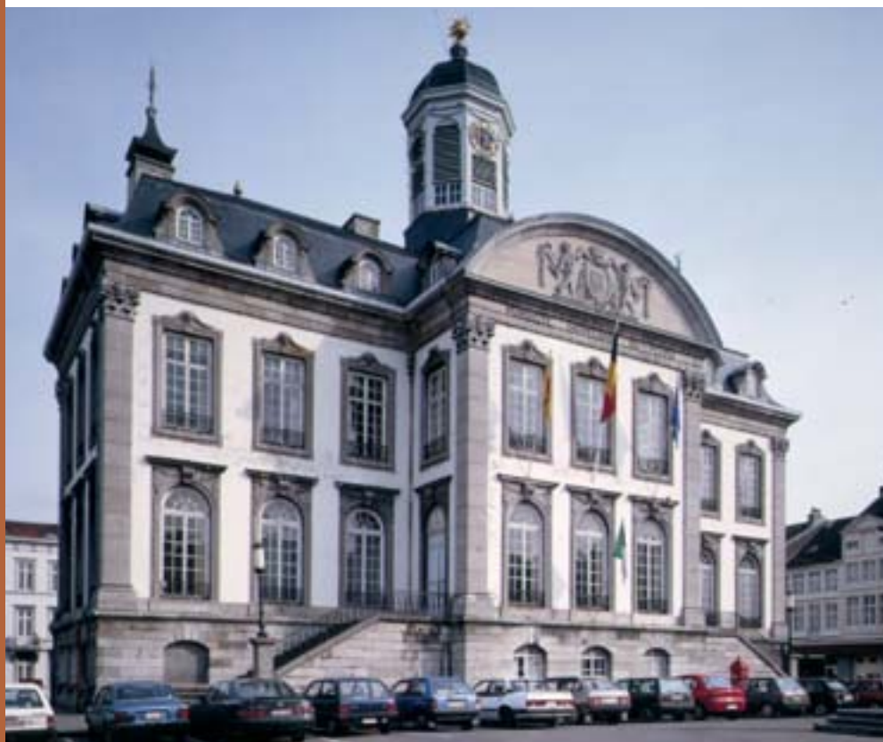
Hôtel de ville de Verviers.