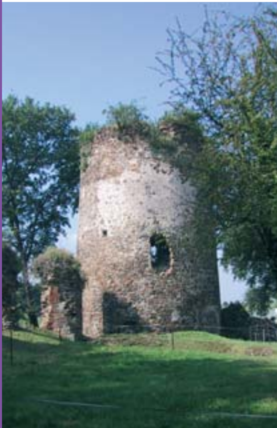
Vue du donjon.

Le château de Walhain-Saint-Paul (Brabant wallon) a été classé comme monument en 1955. De cet ensemble philippin caractéristique dans le paysage brabançon aux vestiges ponctuel-