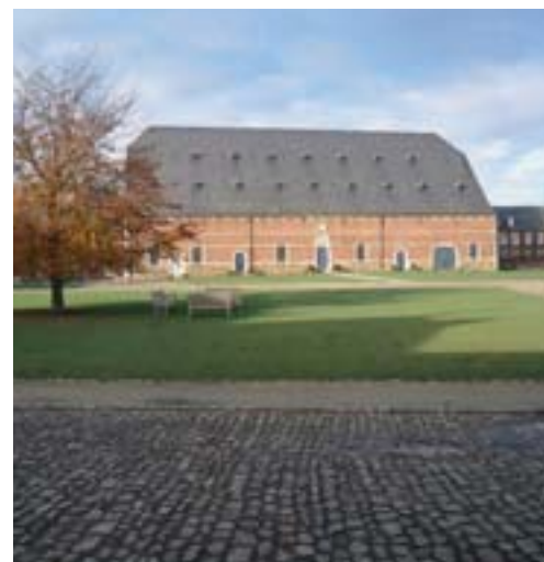
La grange de l'ancienne abbaye de La Ramée.

C'est dans ce même esprit de promotion du patrimoine et de la culture que le Ministre du Patrimoine vient d'accorder à la commune d'Aubange une subvention de plus de 500.000 euros pour restaurer et aménager en Syndicat d'initiative la ferme du domaine de Clémarais, seul vestige du second château de Clémarais élevé au XVIII e siècle.