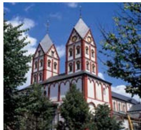
L'ancienne collégiale Saint-Barthélemy restaurée.

Bref, un édifice majeur du patrimoine liégeois et wallon qui revit.