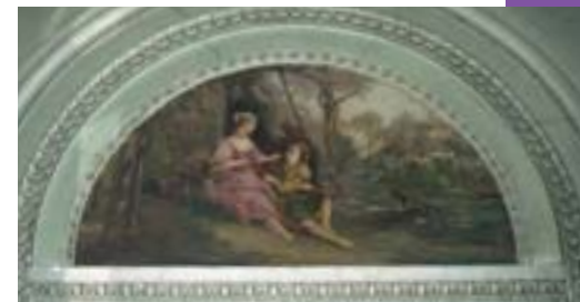
L'hôtel Biolley à Verviers

En 2001, l'Hôtel de Biolley, place Sommeleville à Verviers, est devenu propriété de la Fondation Roi Baudouin, qui en a confié le projet de réhabilitation à un Fonds présidé par l'Administrateur général de l'Institut du Patrimoine wallon. Dans ce cadre, une étude archéologique préalable a été menée dans le courant de la même année. Cet examen préliminaire ne répondait pas encore aux demandes précises d'un projet bien défini à l'époque. L'approche s'avérait dès lors globale et généraliste.