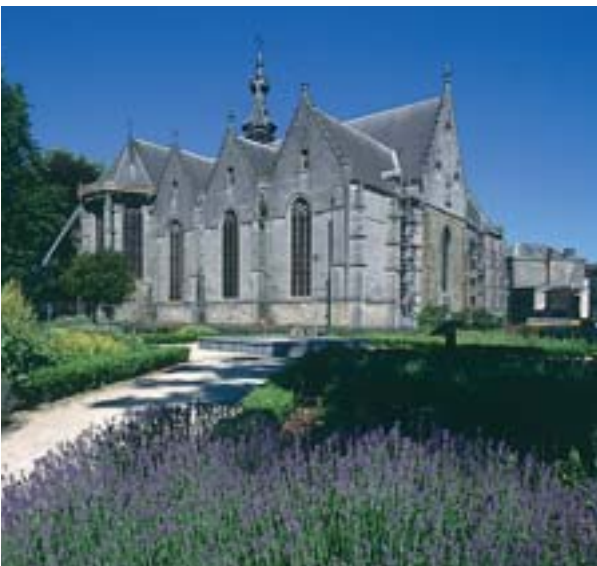
L'ancienne collégiale Saint-Ursmer de Binche.

Dès l'année 2005, la Région wallonne a débouqué de nombreuses aides visant à la restauration de nos collégiales. C'est, tout d'abord, la collégiale Notre-Dame de Huy qui en a bénéficié. Cet édifice gothique, bâti dès 1311, est classé comme monument depuis le 1 er août 1933 et inscrit sur la liste du Patrimoine exceptionnel de Wallonie depuis 2002. La subvention (près de 84.000€), couvrant 95% du montant des travaux en raison du caractère exceptionnel du bien, a porté sur des réparations urgentes à effectuer à la toiture de la tour occidentale.