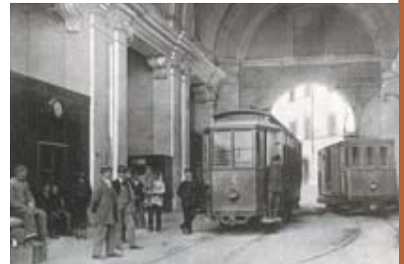
Carte postale : l'église San Domenico de Camerino en 1905

La réaffectation du patrimoine religieux est une question qui manifestement préoccupe les pouvoirs publics depuis longtemps. En atteste cette photographie de 1905 qui montre l'intérieur de l'église San Domenico de Camerino en Italie (Les Marches) transformée en dépôt de trams!