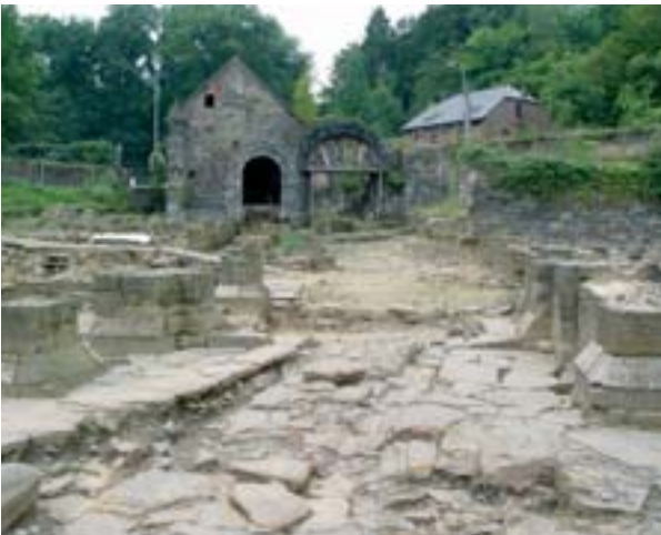
Chantier de fouilles de la porterie de Villers. Vue vers l'ouest. Au premier plan, quelques restes du soubassement de la porterie intérieure. À l'arrière plan, à une trentaine de mètres, la porte de Bruxelles

Le Service de l'Archéologie en Brabant wallon (MRW) et l'Abbaye de Villers-la-Ville asbl ont clôturé en septembre 2005 les fouilles de la porterie de l'ancienne abbaye cistercienne de Villers-en-Brabant (1146-1796). Au début de l'année 2006, deux archéologues ont été engagés en vue de la réalisation du rapport final. L'objectif premier des fouilles est d'établir le cahier des charges archéologiques de la porterie, préventivement aux travaux de réhabilitation comme entrée pour les visiteurs.