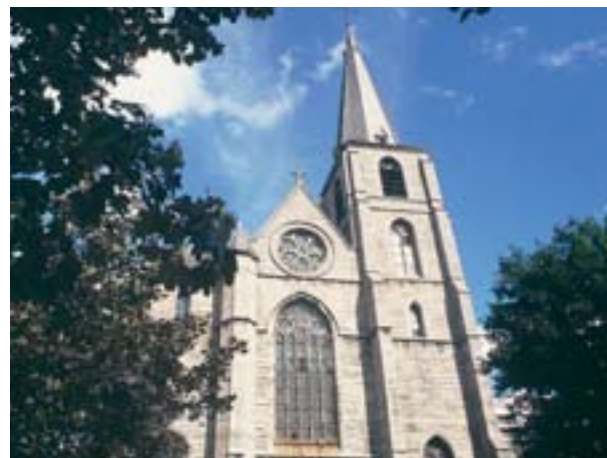
Vue de Sainte-Marie-Madeleine

Si les premiers résultats de cette étude renseignent sur les phases post-médiévales, le niveau de circulation primitif, probablement détruit dans son ensemble, sera évalué en terme de degré altimétrique lors du sondage de reconnaissance autour d'une base de colonne de la nef. Cet examen devrait permettre de préciser les informations archéologiques pour les transmettre aux acteurs de la restauration et de la mise en valeur de l'édifice. Marianne DECKERS.