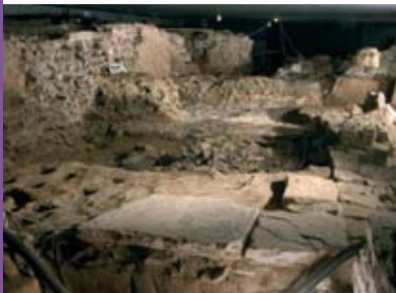
Vue d'ensemble des fouilles de l'Archéoforum.

Depuis août 2005, l'Institut du Patrimoine wallon a engagé sept personnes qui œuvrent sur les sites de l'Archéoforum et de la place Émile Dupont à Liège. Cette équipe, dont la coordination scientifique est assurée par le Ministère de la Région wallonne, est composée de trois archéologues, deux dessinateurs, un technicien et un opérateur. Leur mission comprend deux volets spécifiques. L'un a trait aux expertises et aux études archéologiques, l'autre couvre la conservation de ces deux sites à caractère muséal.