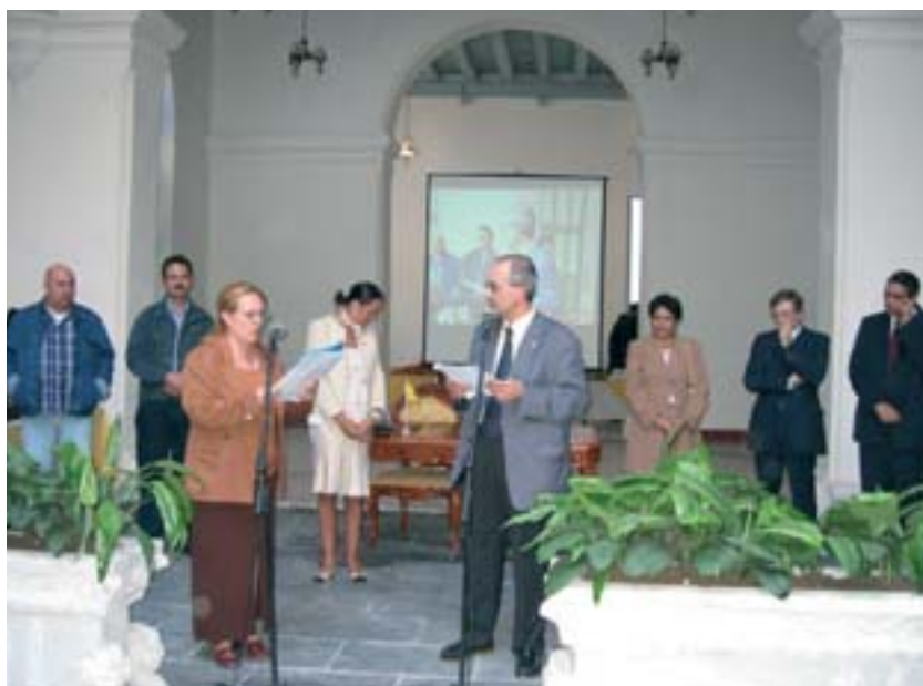
Inauguration de la vitrine wallonne

C'est en effet suite aux décisions des Ministres Jean-Claude Van Cauwenberghe et Michel Daerden que la Région wallonne a décidé en 2002 d'investir dans le bâtiment Conde Canongo en permettant sa restauration qui inclut la mise à disposition de logements sociaux en ses étages supérieurs et l'installation, au rez-de-chaussée, d'une vitrine qui met à l'honneur les divers aspects de notre belle Région (patrimoine, tourisme, ressources naturelles, culture...). Une vitrine conçue par