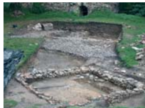
Fouille des édifices modernes de la haute cour.

Deux secteurs livrent peu à peu leurs secrets. La vaste terrasse de la basse-cour est aménagée sur les flancs du valon limoneux baigné par le ruisseau de Chevequeues. Les niveaux supérieurs d'occupation y ont révélé les vestiges des fermes du XIV e -XV e siècle, puis de plus vastes bâtiments d'exploitation du XVI e siècle, occupés jusqu'à la première décennie du XVII e siècle et que les comptes de la seigneurie documentent assez bien. L'examen archéologique et pédologique des stratigraphies profondes de la basse-cour et des douves,