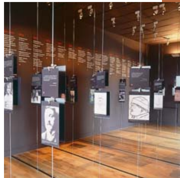
Vue du Musée Apollinaire.

Enfin, en terme de tourisme d'affaires, la fréquentation continue également à augmenter au point d'être devenue, pour la première fois en 2005, la première source de revenus de l'asbl. Au total celle-ci génère d'ailleurs 63% de recettes propres, ce qui est un résultat extrêmement positif pour un outil de ce genre. www.abbayedestavelot.be