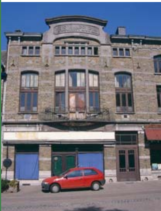
La Maison du Peuple à Poulseur

La Maison du Peuple de Poulseur a été achetée par la commune de Comblain-au-Pont en 1997 dans le cadre d'une opération communale de développement rural en vue de réaliser un projet d'occupation mixte. L'étude de faisabilité, réalisée en 1998 par l'auteur de projet désigné, a servi de base à la réflexion et une procédure de certificat de Patrimoine a pu être instituée en 1999.