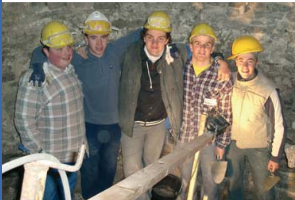
C'est au pied du mur que l'on voit... les vrais maçons

Après l'intervention de deux entreprises, l'une pour le traitement des éléments en bois, l'autre pour le traitement de l'humidité, nous planifions le programme des formations (relevé, restauration des menuiseries, nettoyage des façades, enduits). Le planning sera défini précisément dans notre prochain programme des stages 2006-2007 qui paraîtra en juin prochain.