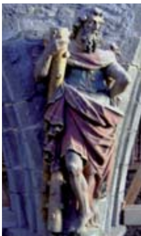
Saint André

L'église Sainte-Marie-Madeleine est un édifice gothique construit en 1252, qui présente une grande simplicité formelle et qui a subi peu de remaniements importants. Elle est classée comme monument pour sa valeur artistique, archéologique et historique le 15 septembre 1936.