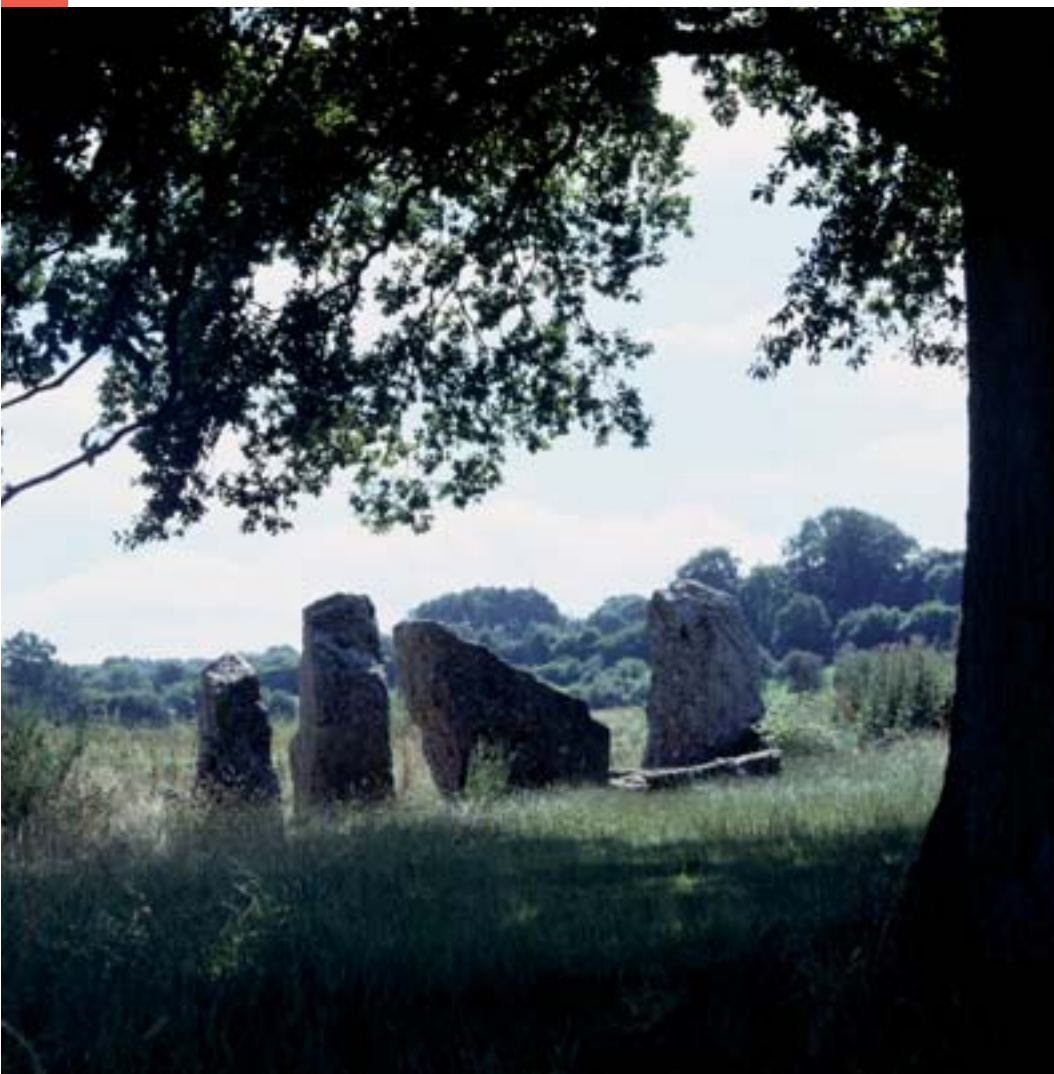
Vue du site archéologique de Wéris (Durbuy)

CHIREL BW asbl: chaussée de Bruxelles, 65a - B-1300 Wavre - +32 (0)10 23 52 79 - Courriel: archives@bw.catho.be - site: www.chirel.be.tf. M.-A. COLLET.