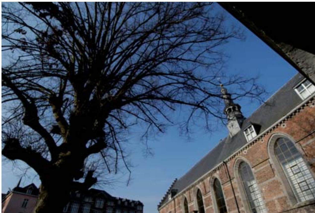
Hôpital Notre-Dame-à-la-Rose à Lessines