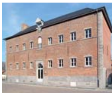
Brasserie Rivière à Ath

En 1980, l'ancienne salle des brassins est classée comme monument pour sa valeur esthétique, historique et sociale et, en 1992, le classement est étendu à l'ensemble du bâtiment. En septembre 2001, l'Institut du Patrimoine wallon achète la brasserie qui est dans un état de délabrement très avancé et finance sa restauration qui commence en 2002 et qui s'achève durant le premier semestre 2003. Les façades sont alors restaurées à l'identique et les niveaux de la brasserie sont rénovés afin de retrouver leur charme d'antan tout en étant adaptés aux besoins actuels, notamment en ce qui concerne les sanitaires et les télécommunications.