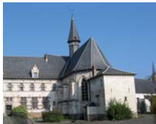
L'hospice des vieillards à Rebecq