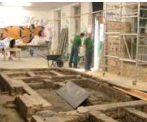
Archéologie du bâti et fouilles en sous-sol, afin de documenter l'histoire des lieux

Amené à quitter l'ancienne boucherie de Namur – ou « Halle al'chair » – où il exposait ses riches collections depuis 1855, le Musée archéologique de Namur s'est récemment vu désigner l'ancienne École des Bateliers comme nouvelle implantation. Propriété de la Ville de Namur, à l'abandon depuis plusieurs années, ces bâtiments ont été récem-