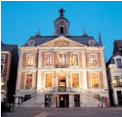
Hôtel de Ville de Huy

En cette année d'élections communales et provinciales, organisées pour la première fois par la Région wallonne, le Ministre du Patrimoine a souhaité mettre l'accent sur les liens entre le Patrimoine