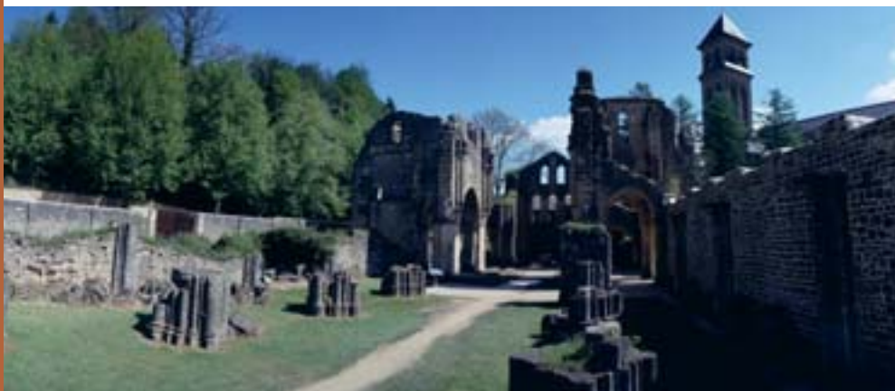
Ruines de l'abbaye d'Orval

Aux termes de l'article 187, 12° du Code wallon de l'Aménagement du Territoire, de l'Urbanisme et du Patrimoine, le Patrimoine exceptionnel est constitué des monuments, ensembles architecturaux, sites et sites archéologiques présentant un intérêt majeur qui bénéficient d'une mesure de protection et dont la liste est déterminée par Arrêté du Gouvernement après avis de la Commission royale des Monuments, Sites et Fouilles. La liste du Patrimoine exceptionnel est soumise à une révision triennale.