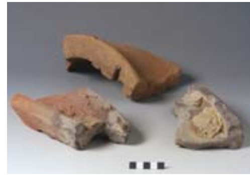
Rebus de cuisson

L'atelier de tuilier date des II e et III e siècles de notre ère. Ce complexe, remarquable par la nature de ses éléments et leur organisation symétrique, illustre la chaîne opératoire propre à ce type d'activité, depuis l'extraction de l'argile jusqu'à la cuisson des produits. Le noyau autour duquel il s'articule est constitué par l'espace destiné à la cuisson des matériaux. Il s'agit d'une aire rectangulaire de 650 m 2 , parallèle à la Meuse, ceinturée par des fossés de drainage et contenant les deux fours anciennement fouillés. Cette surface était protégée des intempéries par une couverture dont la charpente reposait sur plusieurs dizaines de poteaux alignés et disposés à intervalles réguliers. Distants l'un de l'autre de près de 7 m, les fours sont orientés sud-est/nord-ouest et dotés d'une aire de chauffe individuelle. Parmi les autres éléments importants du site figurent quatre constructions de 25 m 2 , destinées peut-être à la mise en forme des tuiles, deux halles de séchage et de stockage d'au moins 75 m de long sur 8 m de large, ainsi que des fosses d'extraction et de multiples fossés.