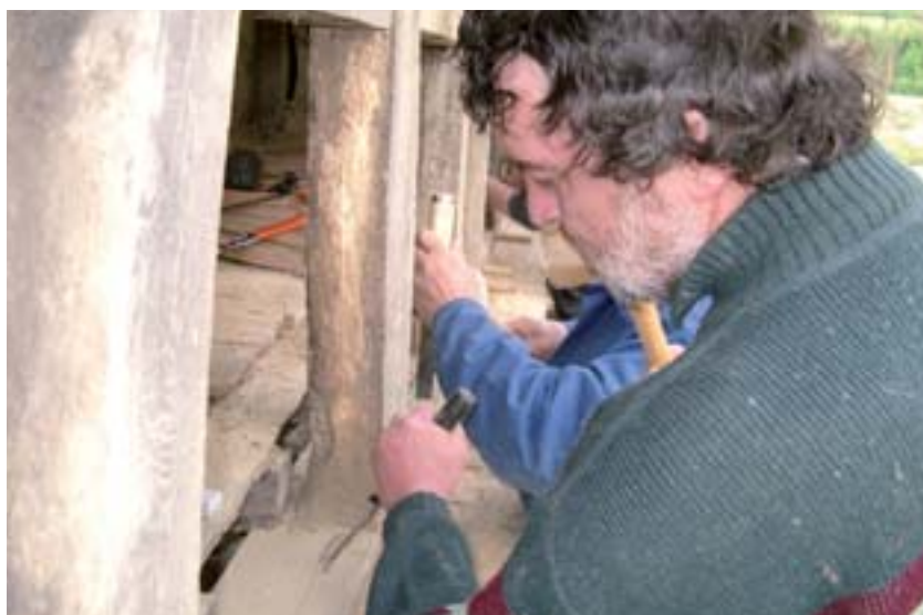
Nouveau programme des stages 2006-2007

Le programme est également disponible sur notre site internet www.paix-dieu.be que nous vous invitons à visiter régulièrement afin de connaître les dernières nouvelles du Centre de la Paix-Dieu.