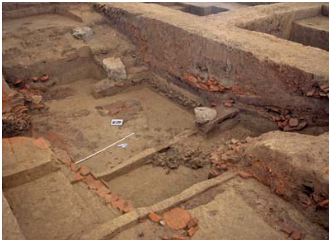
L'aire de service du four oriental