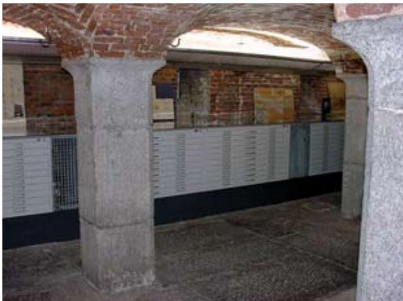
La réserve précieuse

À l'occasion de son Assemblée générale, le 4 mai dernier, la Commission royale des Monuments, Sites et Fouilles a inauguré la réserve précieuse de son Centre d'Archives et de Documentation, dans laquelle elle propose actuellement une expo-documents intitulée «De l'éclectisme au modernisme: deux architectes liégeois, Arthur et Henri Snyers».