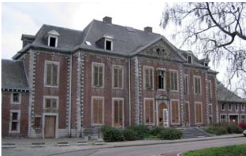
Château d'Angleur

Le château d'Angleur, belle maison de plaisance de la première moitié du 18 e siècle, a été inscrit sur la liste de l'Institut du Patrimoine wallon en 1999. L'état de délabrement avancé de l'édifice et les difficultés financières de son propriétaire ont motivé l'Institut à rechercher des partenaires prêts à investir dans l'acquisition et la réaffectation du château.