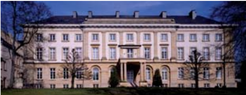
Palais provincial d'Arlon

La vie et l'action de notre asbl sont étroitement liées, depuis sa création, aux administrations chargées par le Gouvernement de la Région wallonne de la gestion de son patrimoine.