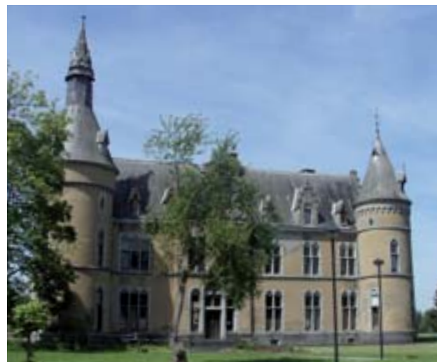
Le château du Faing à Jamoigne

Maison de retraite gérée par des religieuses, puis par le CPAS jusqu'en 1987, les bâtiments sont aujourd'hui à l'abandon et aucun projet d'affectation ne se dessine. La Commune, propriétaire du bien, désire vendre le bâtiment, mais vu son état de délabrement (deux ailes incendiées, les parties classées vandalisées) et sa situation en zone de bâtiments publics au plan communal d'aménagement (PCA), aucun amateur ne s'est fait connaître. L'Institut espère aider la Commune à sauver le bâtiment en entreprenant rapidement des travaux de maintenance.