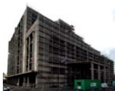
Le triage-lavoir