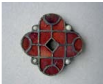
Fibule – L. Baty, DPat © MRW

L'intérêt de cette exposition tient surtout à la qualité des objets présentés au public, mais aussi à sa mise en scène didactique, avec des panneaux explicatifs variés et clairs sur la vie quotidienne à l'époque mérovingienne, avec des mises en situation des objets,