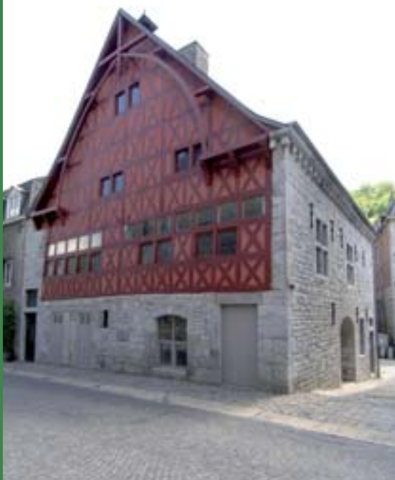
Halle de Durbuy restaurée

Le 16 juin dernier, l'ancienne Halle de Durbuy a été inaugurée par Michel Daerden, Vice-Président du Gouvernement wallon, en charge du Patrimoine. Cet événement a mis le point final à un