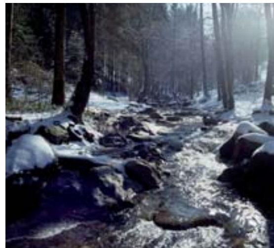
Vallée du Ninglinspo

Une autre facette de la Direction est son travail de contrôle des travaux dans les sites reconnus exceptionnels. Elle y gère donc les certificats de patrimoine et instruit les dossiers concernant les zones