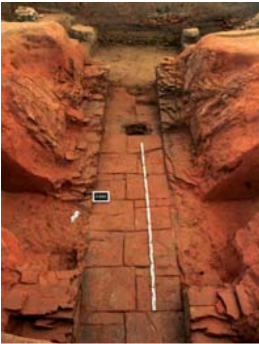
La chambre de chauffe du four oriental, vue depuis le chevet vers l'aire de service

Située en province de Liège, dans la commune d'Engis, la zone d'activité économique de Hermalle-sous-Huy est implantée dans la plaine alluviale de la Meuse, le long de la rive droite du fleuve. La présence de vestiges gallo-romains, dont deux fours de tuilier, au lieu-dit «Campagne de la Gérée», a été mise en évidence durant les années 1960 et 1970 par le Cercle archéologique Hesbaye-Condroz.