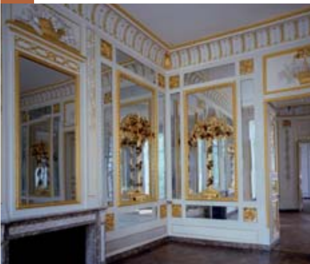
Intérieur de l'Hôtel Hayme de Bomal