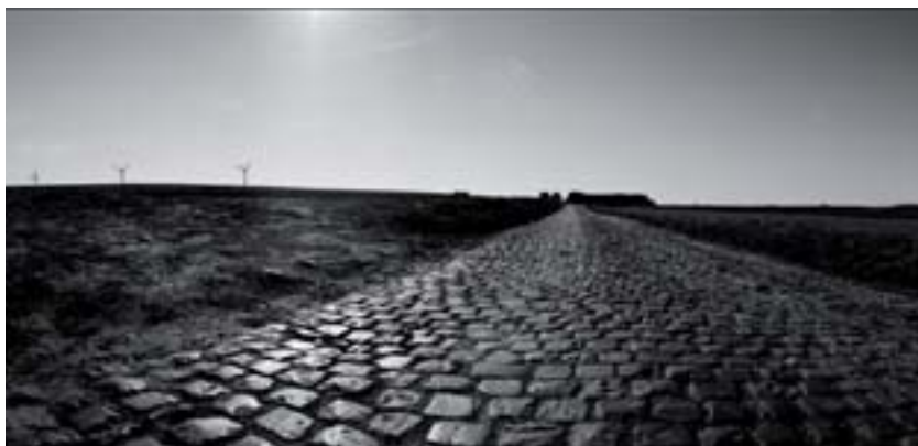
Photo de la voie Bavay-Tongres

La chaussée romaine Bavay-Tongres constituait un axe militaire et commercial important durant l'Antiquité; il reliait le port de Boulogne à la capitale de la Germanie seconde, Cologne. Mais ce qui surprend le plus, c'est la longévité de cette voie. En effet, il est encore possible, à l'heure actuelle, de la suivre pratiquement sans interruption entre Bavay et Tongres.