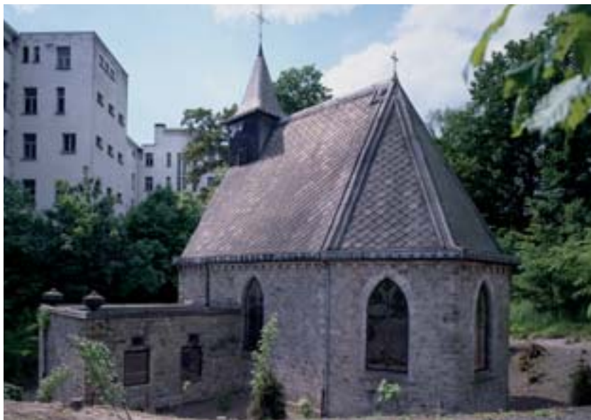
Chapelle Saint-Antoine-en-Barbefosse (1995)

L'Institut, de par sa mission d'assistance aux propriétaires de monuments classés en péril, pourra donc épauler la Fabrique d'église afin d'entreprendre les diverses démarches nécessaires à la mise en place des mesures les plus urgentes. Un programme d'intervention pourra être établi de manière à planifier les interventions indispensables à la préservation de la chapelle menacée et à dégager les moyens financiers fondamentaux pour mener les campagnes de restauration.