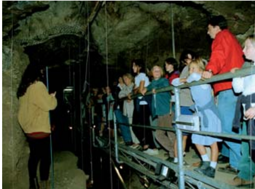
Intérieur de la grotte de Sclayn

Ensuite, et surtout, cette analyse montre que la variabilité génétique des Néandertaliens est plus importante que les chercheurs ne le supposaient sur base des quelques séquences d'ADN fossiles étudiées précédemment. L'apparente érosion de la diversité néandertalienne au fil du temps, de 100.000 ans à environ 50.000 ans, pourrait d'ailleurs s'ex-