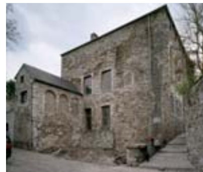
Maison près la Tour à Huy

L'Institut du Patrimoine wallon assure une mission d'assistance aux propriétaires publics ou privés de biens classés dont certains sont menacés ou dégradés ou pour lesquels un projet de restauration et de réaffectation, soit ne se dégage pas, soit nécessite une assistance particulière.