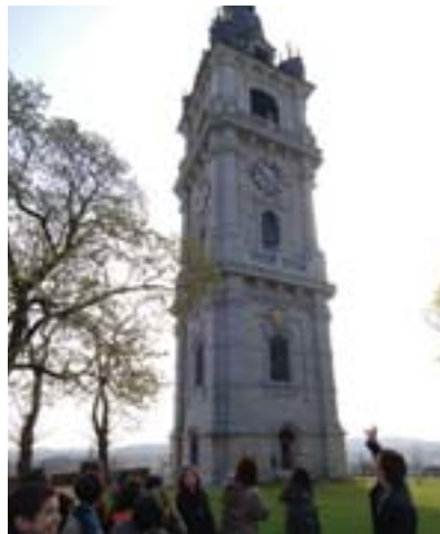
«Journée Jeunesse et Patrimoine» au beffroi de Mons

Enfin, les Journées du Patrimoine seront officiellement ponctuées de deux grandes manifestations ouvertes à tous et à toutes. À Liège, tout d'abord, la première cour du palais des princes-évêques accueillera le vendredi 8 septembre 2006