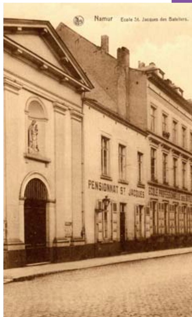
Ancienne École des Bateliers, à Namur: façade – Carte postale ancienne

L'Hôtel de Bouré est ensuite racheté en 1836 par Monseigneur Dehesselle,