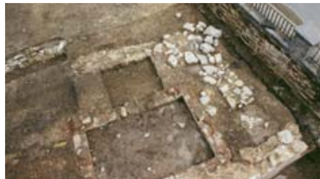
Jemeppe-sur-Meuse. Vue partielle du chantier