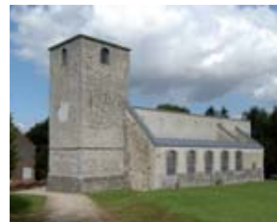
Ancienne église de Lincet

Asbl «Sauvegarde, entretien et promotion du site de l'ancienne église de Lincet», Route de Huy, 73, B-4287 Lincet – N° 423 571 878