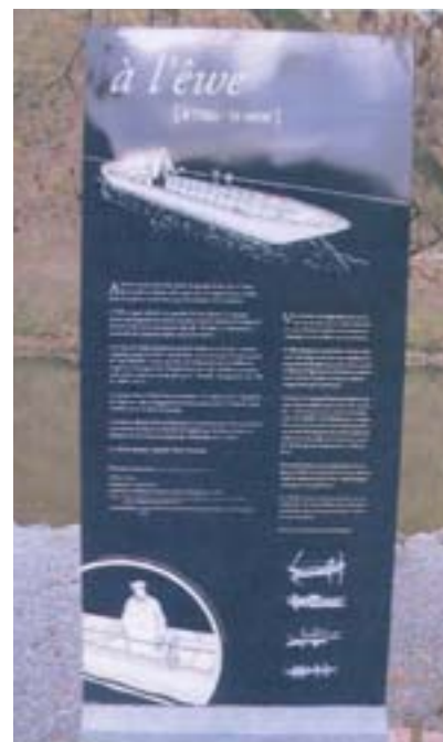
Panneau évoquant le passage d'eau

Sur la plaque réalisée en émail de couleur bleue, les textes en français et néerlandais nous rappellent l'historique de ce qui se faisait jadis quand les ponts n'existaient pas encore. Renseignement: PPPW +32 (0)70 233 736 ou sur le site www.pppw.be - e-mail: pppw@skynet.be