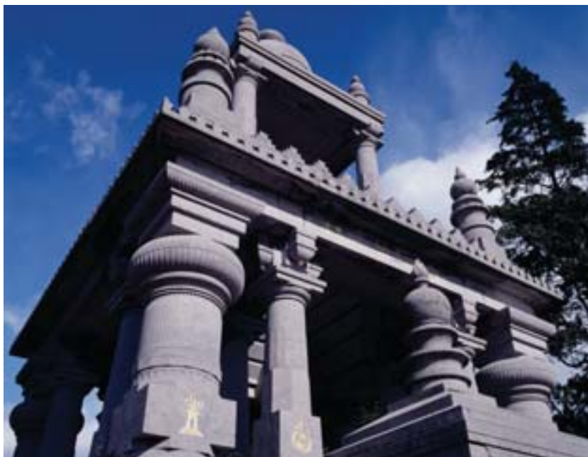
Le mausolée des comtes Goblet d'Alviella (1885) à Court-Saint-Étienne

En conclusion succincte, j'aime rapporter cette remarque d'un vieil homme rencontré lors d'un périple funéraire: «Le respect du politique pour ses administrés se constate dans l'état des cimetières dont il a la responsabilité». Xavier DEFLORENNE.